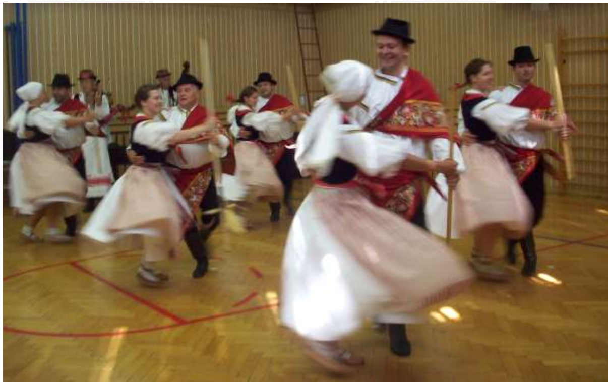
Z vystoupení Slováckého krúžku ve Čtyřlístku.