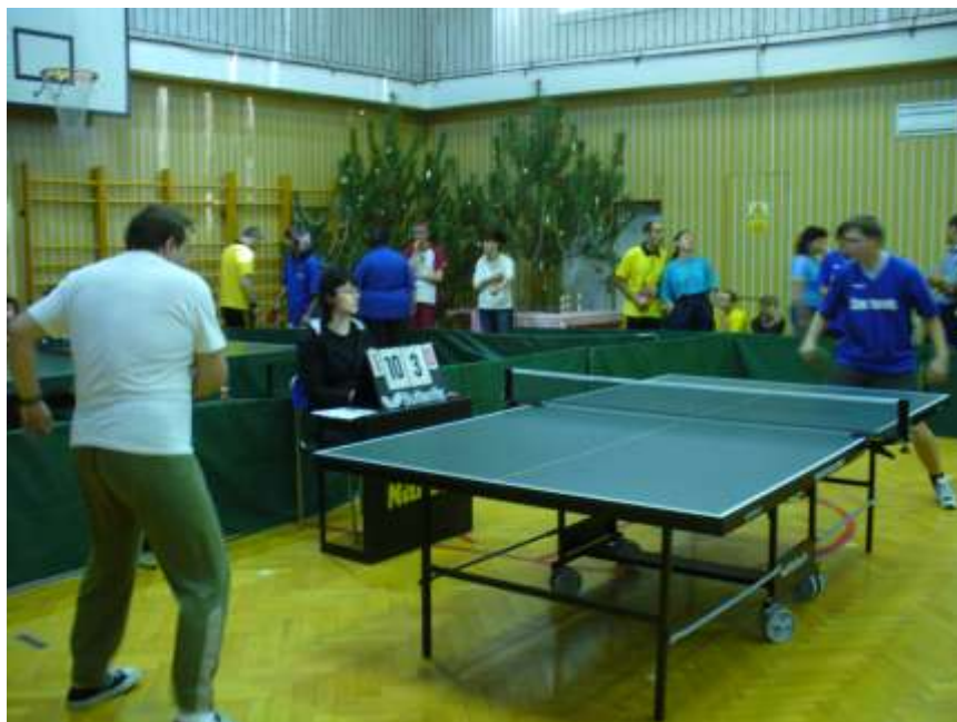
Ilustrační snímek z loňského ročníku Vánočního turnaje ve stolním tenisu ve Čtyřlístku...

Už dnes ale srdečně zveme nejen všechny naše sportovce, kteří v tomto turnaji chtějí změřit své síly s ostatními, ale také další klienty a zaměstnance, aby přišli povzbudit naše borce v jejich úsilí.